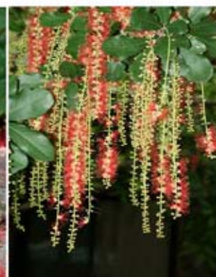
ดอกจิก บุษราคัม ที่บ้านบุญ